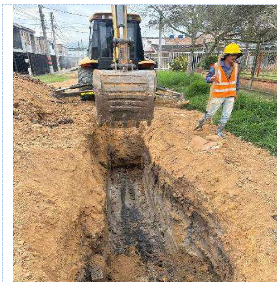
Reposición de alcantarillado sobre CALLE 2 ENTRE INTERSECCION CARRERA 12 Y AV CIRCUNVALAR - BARRIO VILLA MATILDE