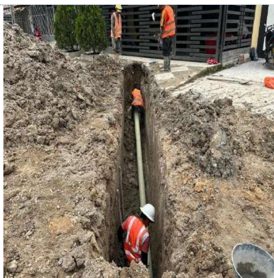
Reposición de alcantarillado sobre CALLE 3D SUR ENTRE CALLE 9 ESTE Y 12 ESTE BARRIO LA PRADERA