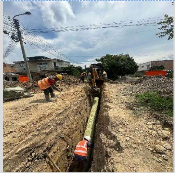
Reposición de alcantarillado sobre CARRERA 9 ESTE ENTRE CALLE 3G SUR Y 3D BARRIO PRADERA BARRIO PRADERA -COSTADO SUR NORTE