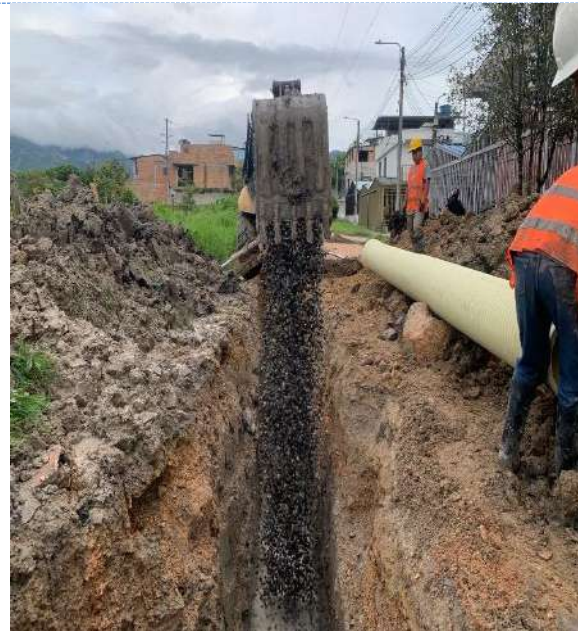
Reposición de alcantarillado sobre CALLE 12ª ENTRE CARRERAS 19A Y 20 BARRIO LOS CRISTALES