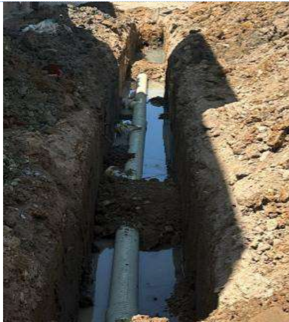
✓ Reposición de alcantarillado sobre CALLE 25C ENTRE CARRERAS 11 Y 11B BARRIO LARA BONILLA