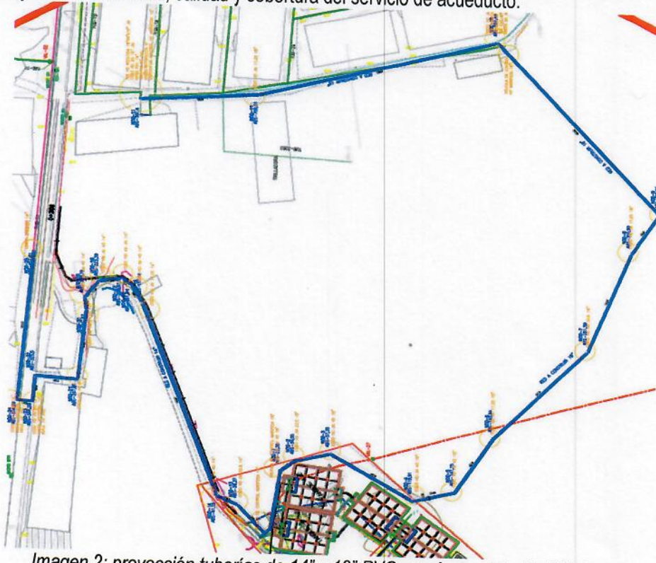
Imagen 2: proyección tuberías de 14" y 18" PVC, según modelación hidráulica.

contemplando en el presente proyecto, realizar la construcción de tubería de 18" y 14" en PVC, enmalles a la red, construcción de cajillas, y demás actividades derivadas de la construcción de tubería, las cuales se han proyectado de acuerdo a un análisis hidráulico realizado por personal profesional de la dirección operativa, donde se optimizo la red, permitiendo así mejorar la continuidad, calidad y cobertura del servicio de acueducto.