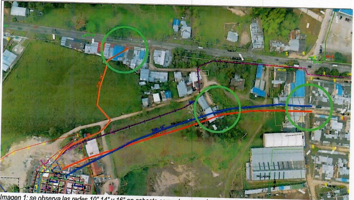
Imagen 1: se observa las redes 10" 14" y 16" en asbesto cemento, pasando por predios privados y por debajo de viviendas.

En relación a las tuberías principales que salen de la planta de tratamiento que actualmente se encuentran en asbesto cemento, es decir las de los diámetros 10" 14" y 16", es importante resaltar que de acuerdo con las estimaciones hechas por la Organización Mundial de la Salud (OMS) cada año mueren en el mundo más de 100.000 personas por enfermedades relacionadas con el asbesto. La OMS advierte que "la exposición al asbesto, incluido el crisotilo provoca cáncer de pulmón, laringe y ovario, mesotelioma y asbestosis", como uno de los principales riesgos, sobre todo para quienes están sobreexposados al contacto con el mineral. Es así que en Colombia se aprobó la LEY No.1968 del 11 JUL2019 "POR EL CUAL SE PROHÍBE EL USO DE ASBESTO EN EL TERRITORIO NACIONAL Y SE ESTABLECEN GARANTÍAS DE PROTECCIÓN A LA SALUD DE LOS COLOMBIANOS". Por lo tanto es indispensable realizar el cambio de material de esta tubería y así preservar la salud de todos los habitantes del municipio de Pitalito.